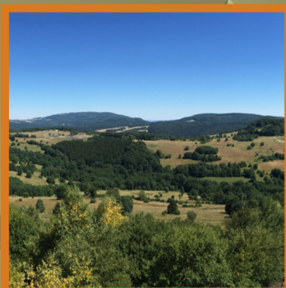
BLICK VOM STEINKÜPPEL

27./28. JULI 2024 START: Sportplatz Wildflecken 6:00 - 12:00 Uhr